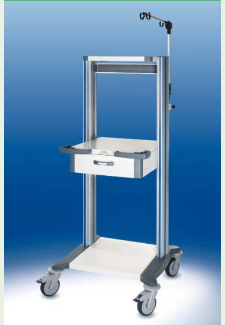
toro Ergometriewagen 45 ▶ Ref.-Nr. 20372