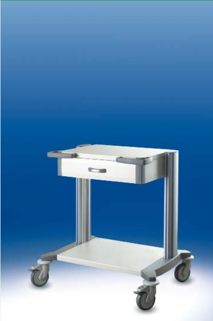
toro Basismodell 60 ▶ Ref.-Nr. 20032