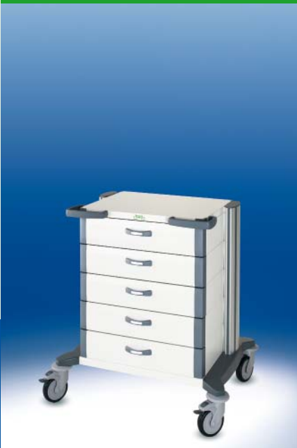
toro Narkosewagen 60 ▶ Ref.-Nr. 20321