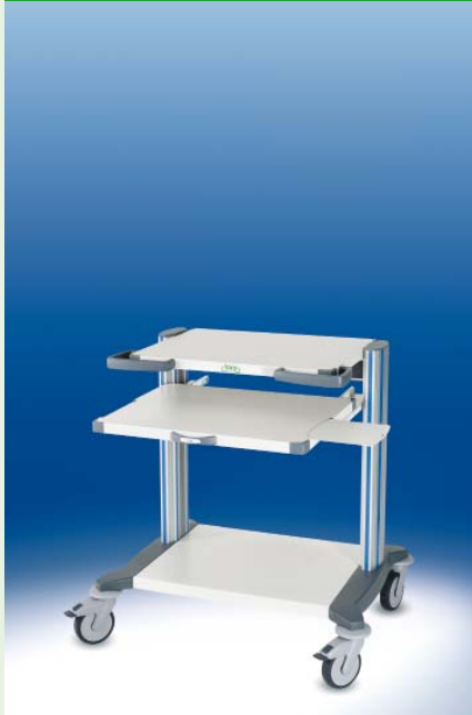
toro Computerwagen 60 ▶ Ref.-Nr. 20222