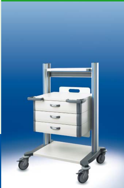
toro Notfallwagen 60 ▶ Ref.-Nr. 20382