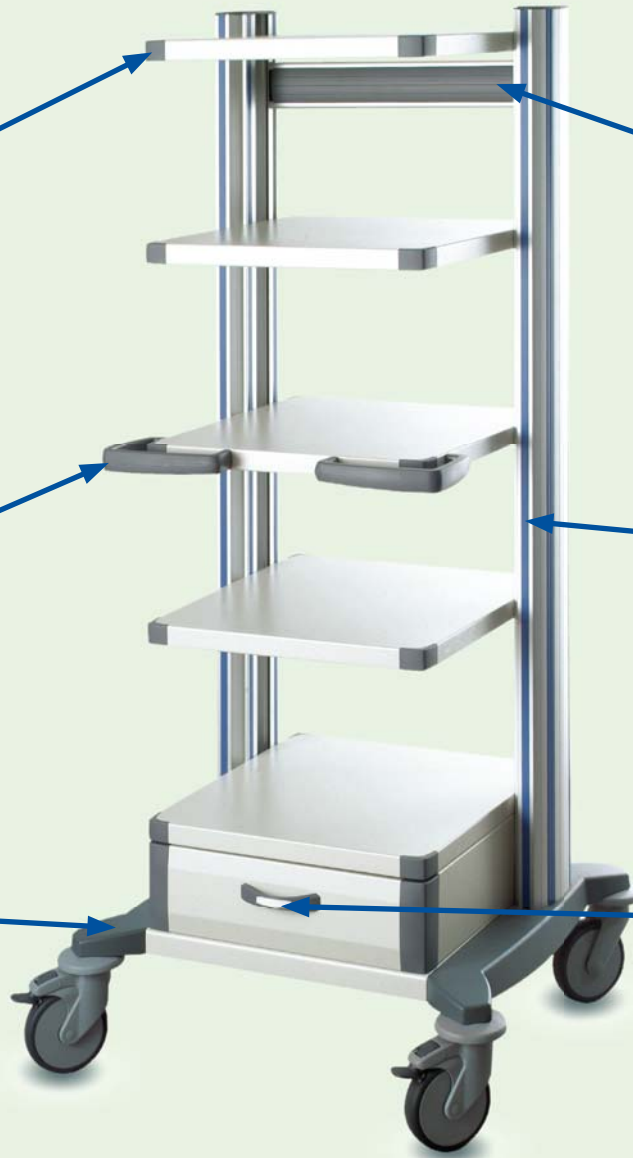
toro-Endoskopiewagen 45 ▶ Ref.-Nr. 20292

Weitere Systemteile und Zubehör entnehmen Sie bitte der Preisliste.