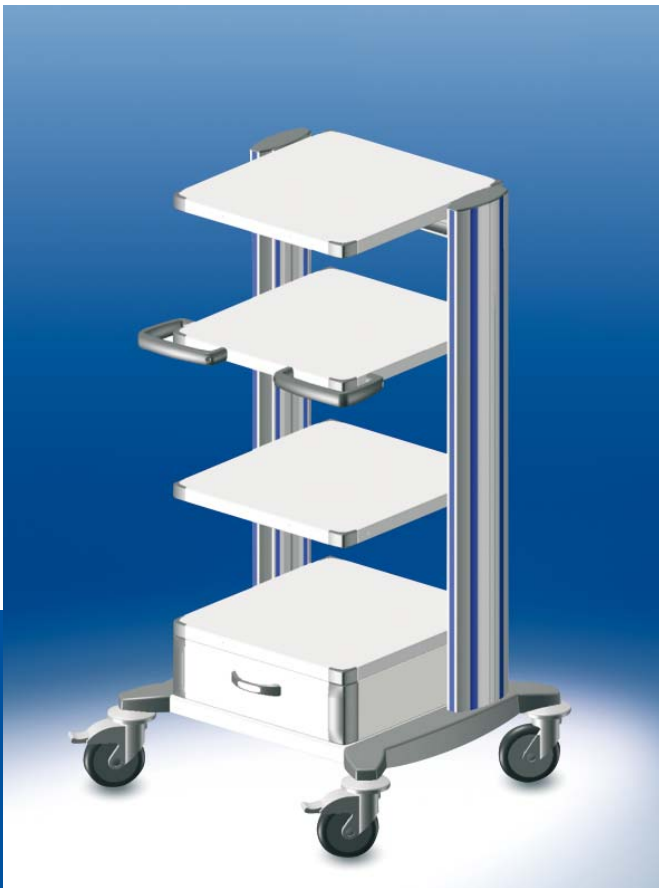
toro Geräteturm 45